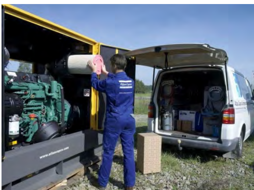
Типовое задание №2. Произвести защитное заземление ДВС