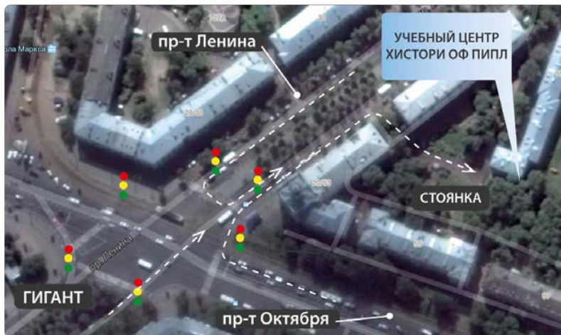
СХЕМА ПРОЕЗДА В УЧЕБНЫЙ ЦЕНТР “ИСТОРИИ ОФ ПИПЛ”

Адрес: 150054, г. Ярославль, пр-т Октября, д.55-а офис 49